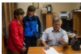
Новая коллекция позднемелового окаменелого дерева. 2017 год