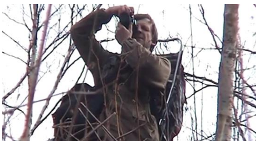
Наблюдение за перелётными птицами весной. 2020 год