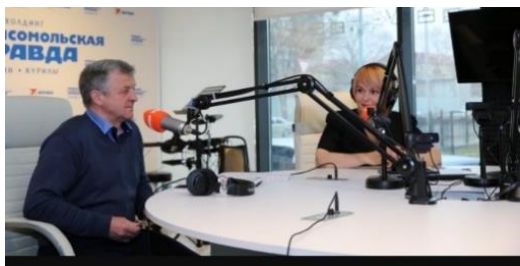
Проект «Историческая среда» к 125-летию сахалинского музея.