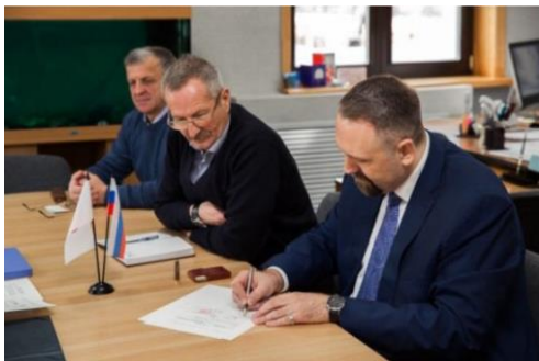
Встреча с представителями краеведческого музея Японии в центре Хоккайдо