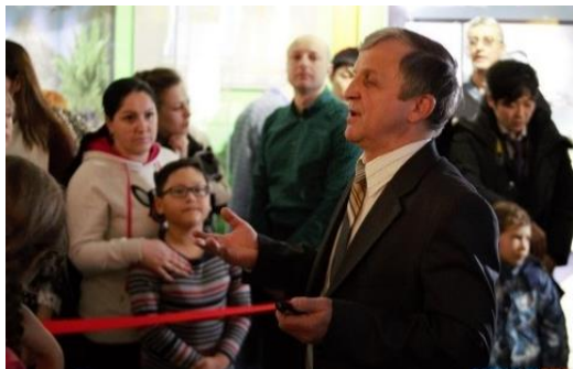
Демонстрация первой реплики Сахалинского динозавра в краеведческом музее. 2017 год