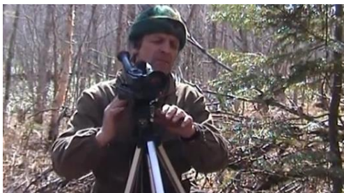
Наблюдение за крапивниками, которые кормятся на берегу ручья